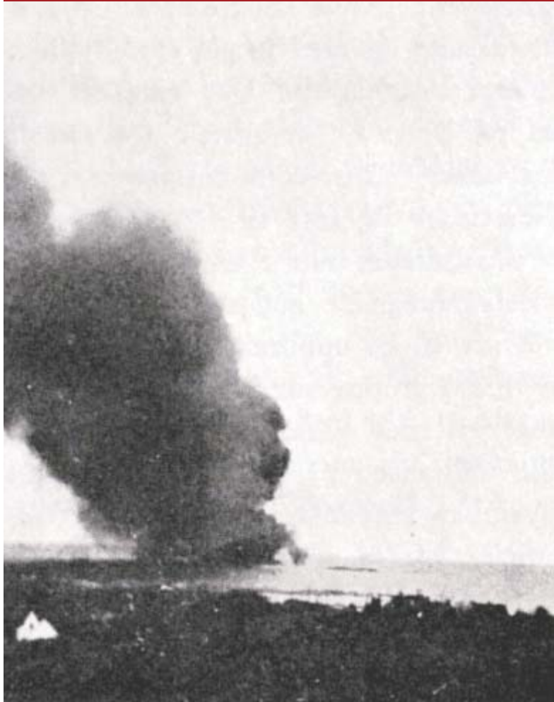
▼ britiske fly. Den norske tankbåten «Inger Johanne» var på vei fra Kjevik til Oslo